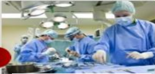
ألمانيا بلد الطب والسياحة الاستشفائية