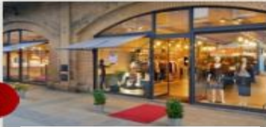
خدمات متكاملة لزوار ألمانيا