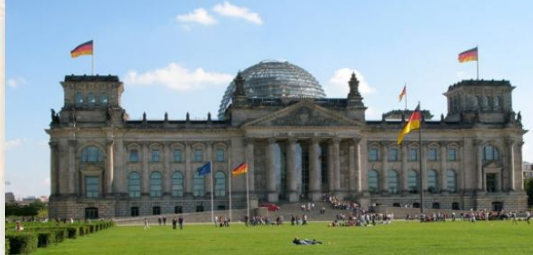
جمهورية ألمانيا الاتحادية