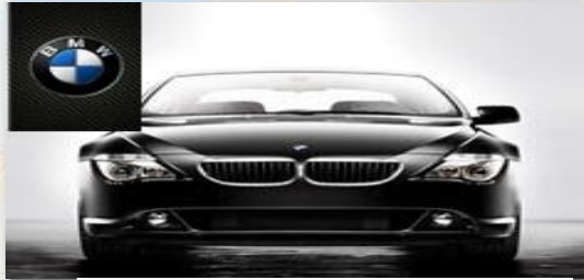
شركات ألمانية رائدة