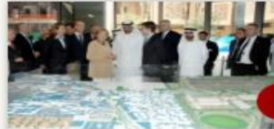
اقتصاد جمهورية ألمانيا الاتحادية