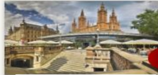
السياحة في جمهورية ألمانيا الاتحادية