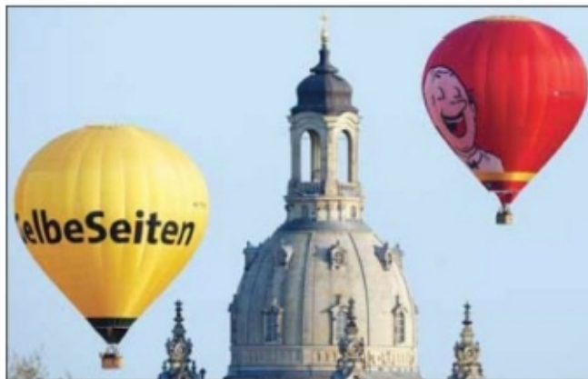
● إحدى كاتدرائيات المدينة