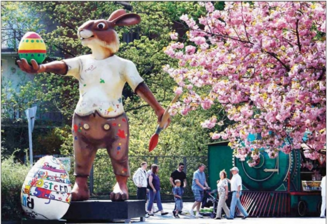
• زوارها ينشدون الراحة ويعدونها .. الصورة أسس في عيد الفصح