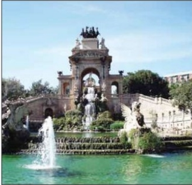
● احد معالم دوسلدورف