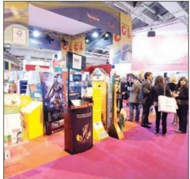
● التسوق في دوسلدورف

شهرة دوسلدورف كعاصمة للموضة العالمية ومركز لأحدث تصاميم الأزياء يتجاوز الحدود المحلية، خصوصاً أنها تمثل موطناً لمعرض الموضة IGEDO ولعدد لا يحصى من صالات عرض أبرز المصممين العالميين. ولذلك لا عجب في اجتذابها لعدد كبير من السياح العاشقين للتسوق، من بينهم العديد من الزوار القادمين من منطقة دول مجلس التعاون الخليجي. ومن أشهر وجهات التسوق في عاصمة الراين يبرز شارع الملك «كونيغسأليه» المشهور عالمياً بفخامته ورقي المتاجر المنتشرة فيه. فعندما يسأل المرء أحد زوار المعارض أو رجال الأعمال المسافرين، عما ينبغي للمرء بلا شك رؤيته أو القيام به أثناء إقامة قصيرة في دوسلدورف، فإن أول ما تسمعه غالباً: التسوق في شارع الملك «كونيغسأليه». ويطلق أهل دوسلدورف على هذا الشارع تحبباً اسم «كو». ويتميز «كو» الذي يبلغ طوله حوالي كيلومتر، بعرضه المثير للعجاب، وبخندق «كو-غراين» (يصل طول الخندق إلى 580 متراً وعرضه 32 متراً) الذي تجري فيه مياه دوسلدورف الأصلية. وأيضاً بصف الأشجار الذي يضم حوالي 120 شجرة كستناء. ويفصل الخندق المائي بين الجانبين الشرقي والغربي لشارع الملك بينما تربطهما العديد من الجسور، مما أعطى لكل من هذين الجانبين طابعاً خاصاً.