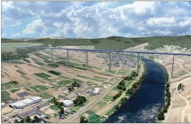
● طرق سريعة حديثة ومناظر مبهرة في الطريق إليها